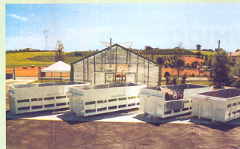
▲ ISOLA ECOLOGICA MAGGIORE